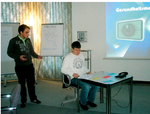
Beispiel des 1. Workshops: richtiges Sitzen

Die Firma Nabaltec AG, ein Unternehmen der chemischen Industrie, nimmt seine ökologische und soziale Verantwortung ernst. Neben der klassischen Zertifizierung nach ISO 9001 hat die Firma im Laufe der Jahre ein zertifiziertes Umweltmanagementsystem (ISO 14001), ein Gesundheits- und Arbeitssicherheitsmanagementsystem (OHSAS 18001) und ein Energiemanagementsystem (ISO 50001) eingeführt.