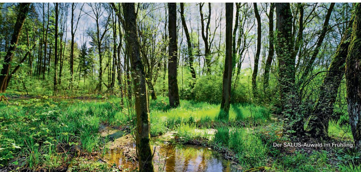
Der SALUS-Auwald im Frühling