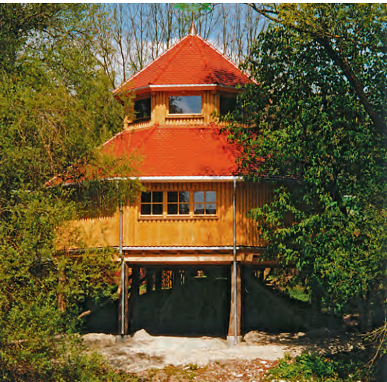
Das Tierkundemuseum Markt Bruckmühl im SALUS-Auwaldbiotop

Des Weiteren hat der Auwald eine wichtige Funktion als Brut- und Durchzugsgebiet für Vögel.