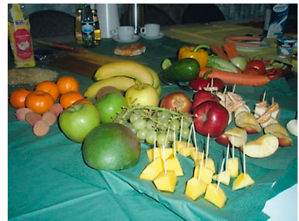
Beispiel des 1. Workshops: gesunde Ernährung

Nabaltec AG www.nabaltec.de Infozentrum UmweltWirtschaft: Übersicht zum Thema Nachhaltigkeit Online-Tool Nachhaltigkeitsmanagement für KMU