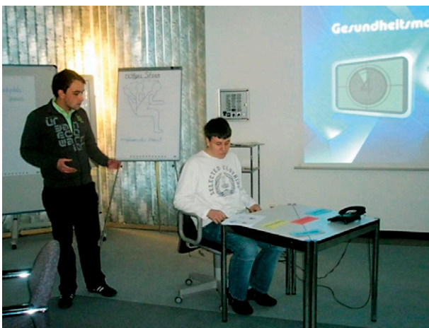
Beispiel des 1. Workshops: richtiges Sitzen

Die Firma Nabaltec AG, ein Unternehmen der chemischen Industrie, nimmt seine ökologische und soziale Verantwortung ernst. Neben der klassischen Zertifizierung nach ISO 9001 hat die Firma im Laufe der Jahre ein zertifiziertes Umweltmanagementsystem (ISO 14001), ein Gesundheits- und Arbeitssicherheitsmanagementsystem (OHSAS 18001) und ein Energiemanagementsystem (ISO 50001) eingeführt.