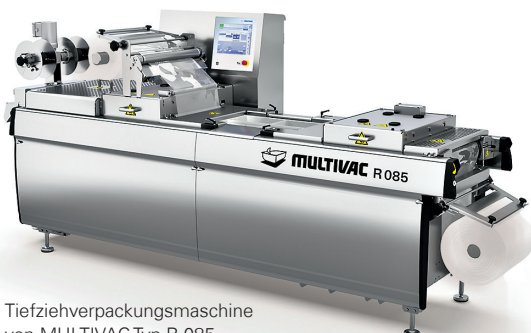
Tiefziehverpackungsmaschine von MULTIVAC Typ R 085