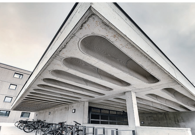
Tiefgaragendach mit 3D-gedruckten Betonschalen

Auf Initiative der EIGNER Bauunternehmung GmbH wurde die Decke der Tiefgarageneinfahrt mit einer innovativen 3D-Betondruck-Bauweise erstellt. Die Deckenkonstruktion wurde vom Institut für Tragwerksentwurf der Technischen Universität Graz entworfen, geplant und begleitet. Ursprünglich als 25 cm starke Betonflachdecke gedacht, wurde das Tragwerk als Rippendecke mit aneinandergereihten, konisch geformten Betonschalen mit einer Länge von etwa 6,4 m, einer Breite von etwa 58 cm und einer durchschnittlichen Höhe von 27 cm geplant. Die Schalen haben einen Abstand von rund 10 cm, sind mit 8 cm Beton überdeckt und sparen 40 % Material im Vergleich zur Flachdecke ein.